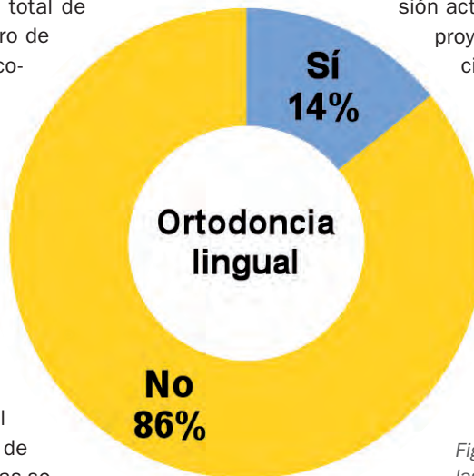
Figura 3. La práctica de ortodoncia lingual en las clínicas.

La metodología prevé la recogida de datos de un grupo de empresas, de modo confidencial y agregado en pleno cumplimiento de la ley sobre la libre competencia, con el desafío de obtener una información de mercado útil para una correcta estimación de las dimensiones del sector y, sobre todo, analizar sus tendencias evolutivas en el tiempo.